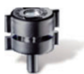
QX-202C (長時間経時の変化観察用)