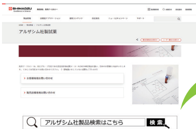
島津ジーエルシー web 内アルザシム製品ページ

島津ジーエルシーのwebページでは、約 5,000 品目近い製品を掲載中。また、CAS 番号や製品番号でお探しの製品を簡単に検索できます！是非一度、ご覧になってみてください。