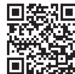
スマホ・タブレットにも対応！

https://solutions.shimadzu.co.jp/glc/faq_reagent.html