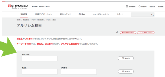
便利な検索機能もあります！