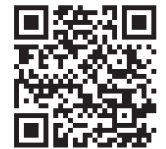
スマホ・タブレットにも対応！

https://solutions.shimadzu.co.jp/glc/faq_reagent.html