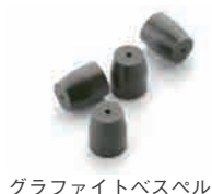
グラファイトベスベル