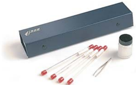
ニードルクリーニングキット