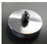
シンプル プレフィックスツール