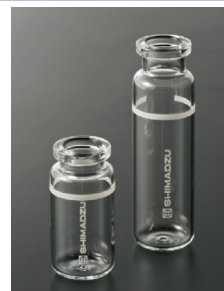
左: 563-G0102 (10mL バイアル) 右: 563-G0101 (20mL バイアル)